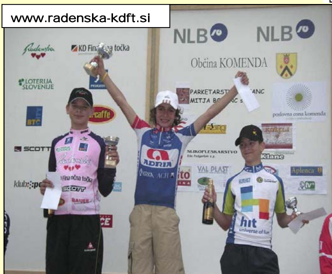
Najboljši tekmovalci na 2.VN Občine Komenda 24.5.2008